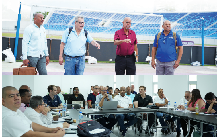
After the meeting, the technicians toured the sports facilities.

The Technical Management of the Santo Domingo 2026 Central American and Caribbean Games held an initial meeting with the International Technical Delegates (ITD) of the sports whose competitions are held at the Juan Pablo Duarte Olympic Center. A total of 14 international technicians completed an initial inspection of the technical work and toured the facilities.