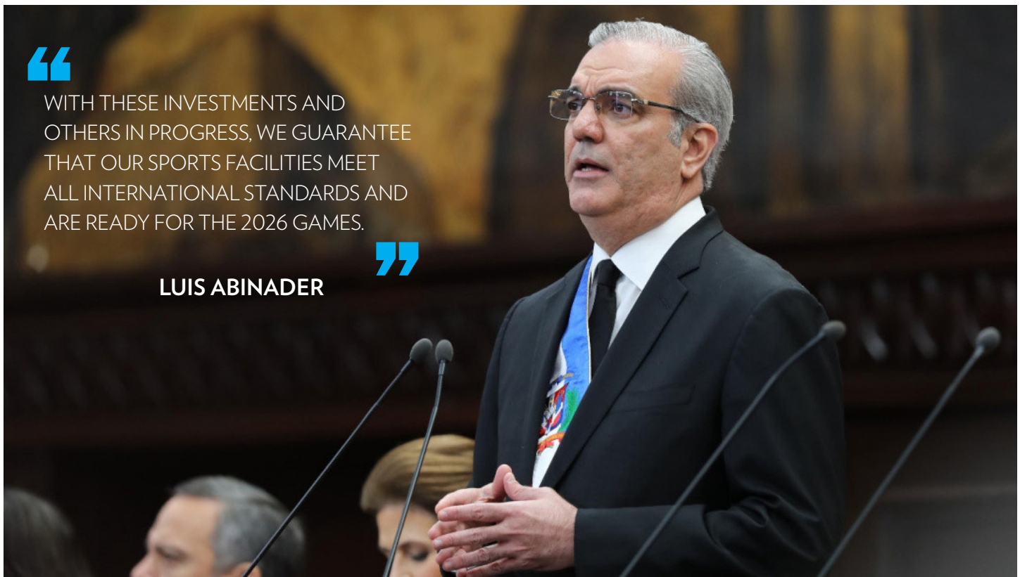
President Luis Abinader speaks in the National Congress during the accountability presentation to the nation.

President Luis Abinader highlighted the fundamental role of sports in the development of Dominican youth and announced an ambitious commitment to modernizing the country's sports infrastructure, including those that will be used for the XXV Central American and Caribbean Games Santo Domingo 2026.