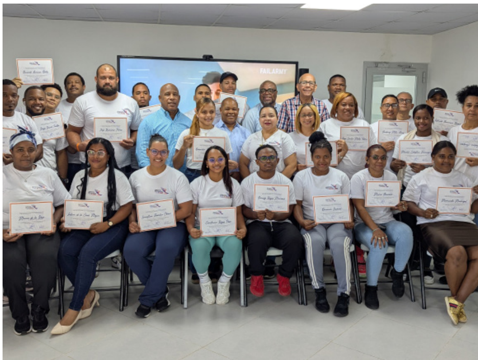
Los graduados muestran sus diplomas que lo acreditan como especialistas en levantamiento de pesas.